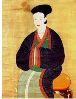
〈그림 1〉 조반 부인상